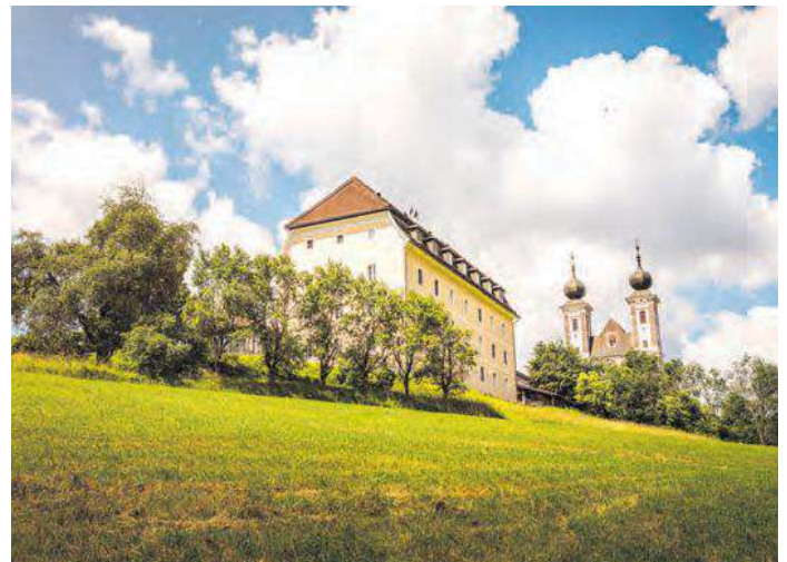
Das Pflegewohnhaus Frauenberg liegt gleich neben der Wallfahrtskirche

E-Mail: pflegewohnh.frauenberg@caritas-steiermark.at