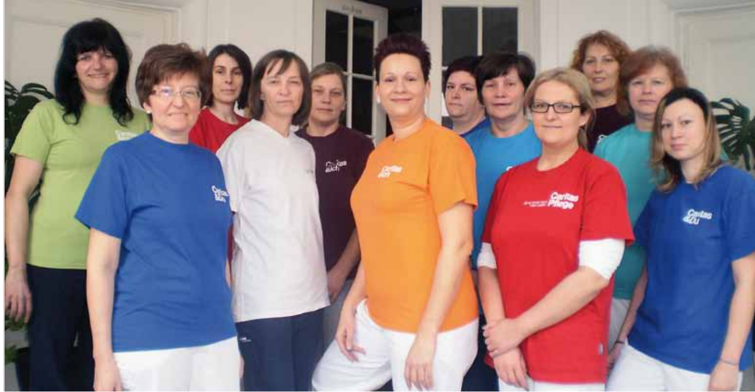
Das Caritas Pflege Zuhause Team Bernhardsthal

Gemeinsam mit Ihnen und Ihren Angehörigen planen wir Art und Umfang der benötigten Betreuung. Wir gestalten gemeinsam mit Ihnen Ihren Alltag, kurz- oder langfristig je nach Bedarf.