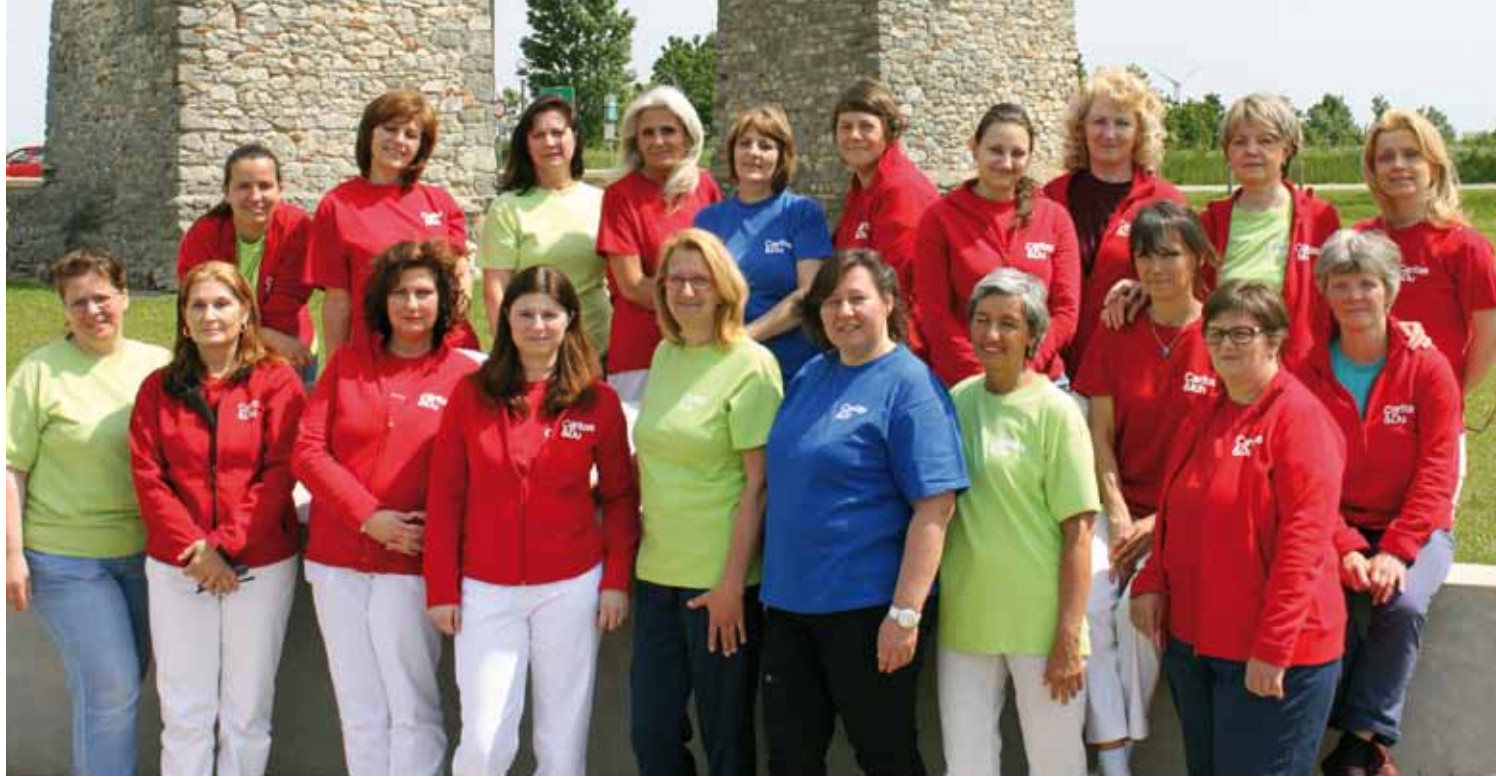
Das Caritas Pflege Zuhause Team Bruck/Leitha

Gemeinsam mit Ihnen und Ihren Angehörigen planen wir Art und Umfang der benötigten Betreuung. Wir gestalten gemeinsam mit Ihnen Ihren Alltag, kurz- oder langfristig je nach Bedarf.