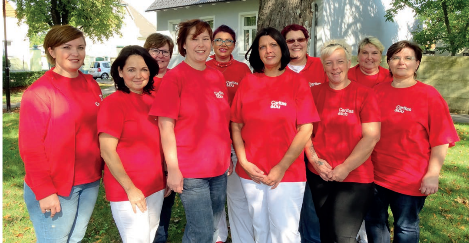
Das Caritas Pflege Zuhause Team Deutsch-Wagram

Gemeinsam mit Ihnen und Ihren Angehörigen planen wir Art und Umfang der benötigten Betreuung. Wir gestalten gemeinsam mit Ihnen Ihren Alltag, kurz- oder langfristig je nach Bedarf.