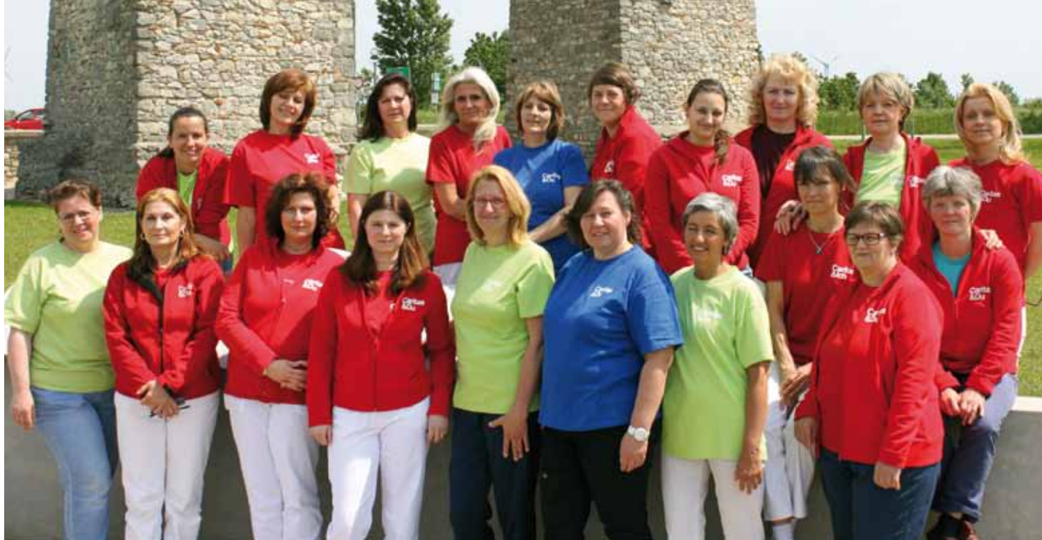
Das Caritas Pflege Zuhause Team Hainburg und Petronell

Gemeinsam mit Ihnen und Ihren Angehörigen planen wir Art und Umfang der benötigten Betreuung. Wir gestalten gemeinsam mit Ihnen Ihren Alltag, kurz- oder langfristig je nach Bedarf.