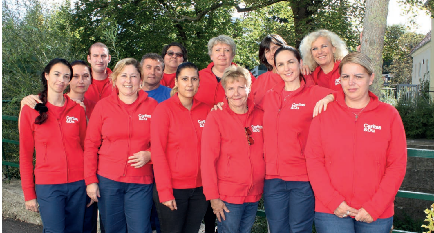
Das Caritas Pflege Zuhause Team Mödling

Gemeinsam mit Ihnen und Ihren Angehörigen planen wir Art und Umfang der benötigten Betreuung. Wir gestalten gemeinsam mit Ihnen Ihren Alltag, kurz- oder langfristig je nach Bedarf.