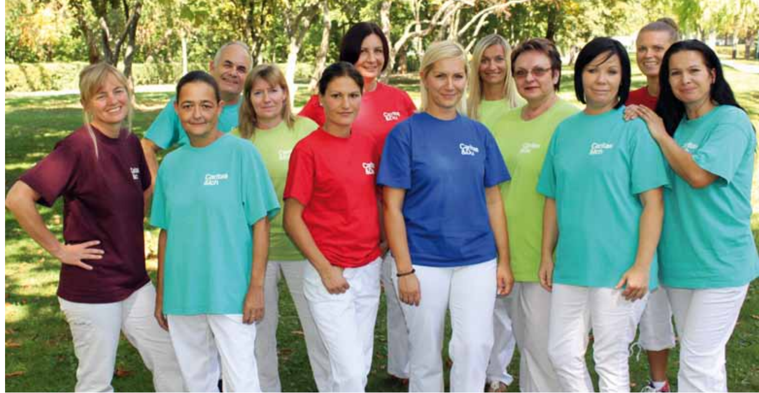
Das Caritas Pflege Zuhause Team Schwechat

Gemeinsam mit Ihnen und Ihren Angehörigen planen wir Art und Umfang der benötigten Betreuung. Wir gestalten gemeinsam mit Ihnen Ihren Alltag, kurz- oder langfristig je nach Bedarf.