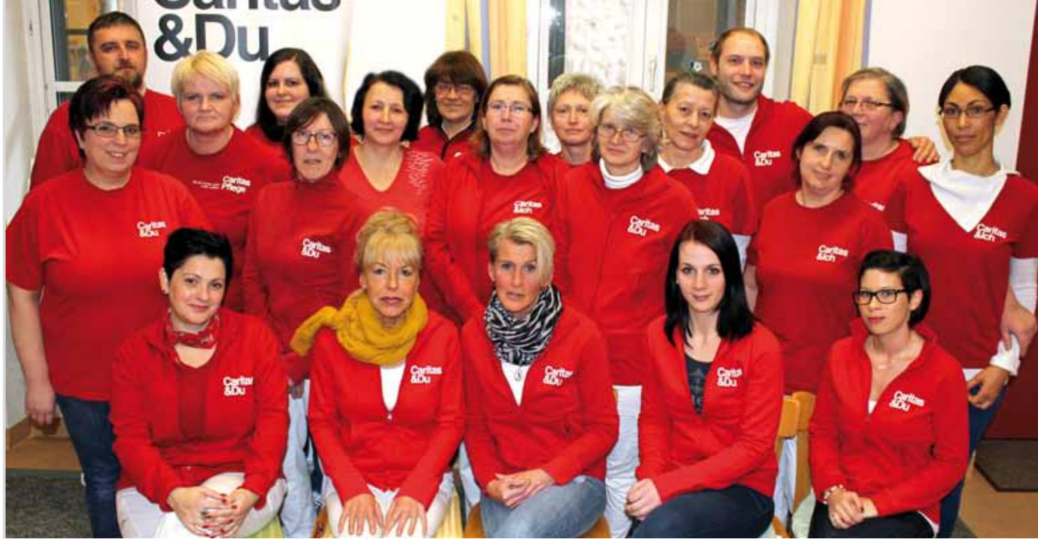
Das Caritas Pflege Zuhause Team Wolkersdorf

Gemeinsam mit Ihnen und Ihren Angehörigen planen wir Art und Umfang der benötigten Betreuung. Wir gestalten gemeinsam mit Ihnen Ihren Alltag, kurz- oder langfristig je nach Bedarf.